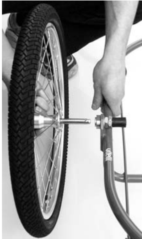
Schnelle Radmontage mit Steckachsen.