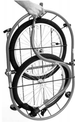
Vitelli-Camping auf Koffergrösse zusammengelegt.