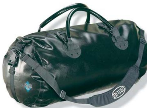
Der wasserdichte Packsack von Ortlieb, Art. 1292RO, 1292SW oder 1296SW, nimmt alles Tourenzubehör auf und passt genau in den Vitelli-Camping.