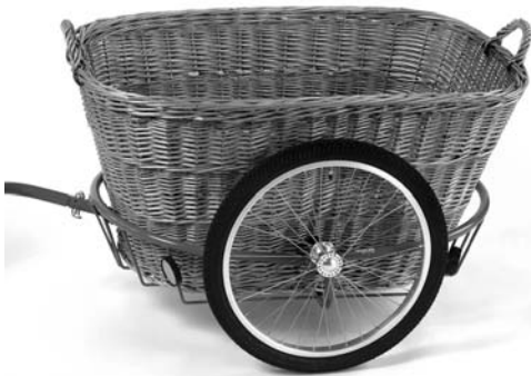
Der geflochtene Weidekorb, Art. 3012, bietet vielfältige Transportmöglichkeiten (Hund, lose Ware, Einkäufe).