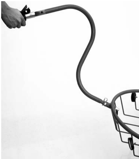
Mit hochgestellter Deichsel kann der Vitelli-Camping auch von grossen Leuten gezogen werden.